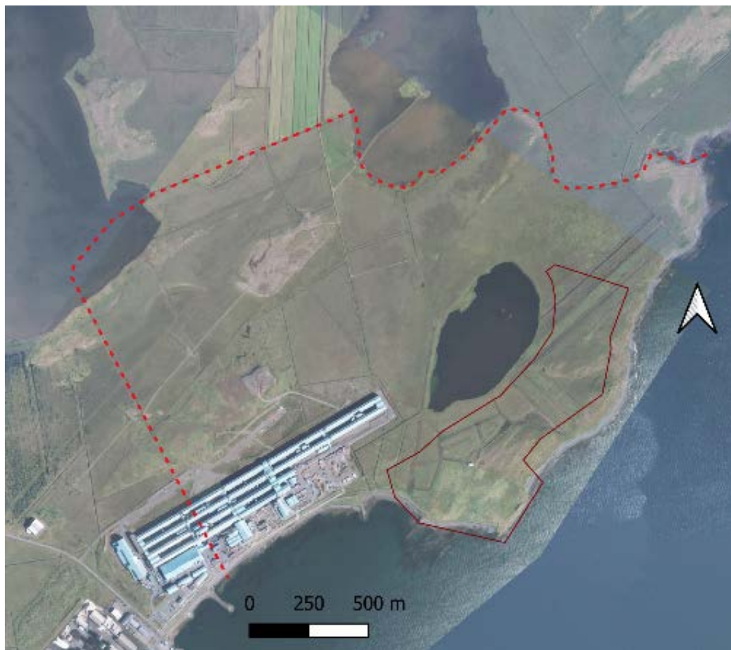
Mynd 1. Kortið sýnir forn landamerki Katanesi (punktalína) og legu framkvæmdareits.

Í þessari skýrslu er birtur árangur heimildarannsókna og vettvangsathugana. Í viðauka er ítarleg skrá yfir fornleifar á reitnum.