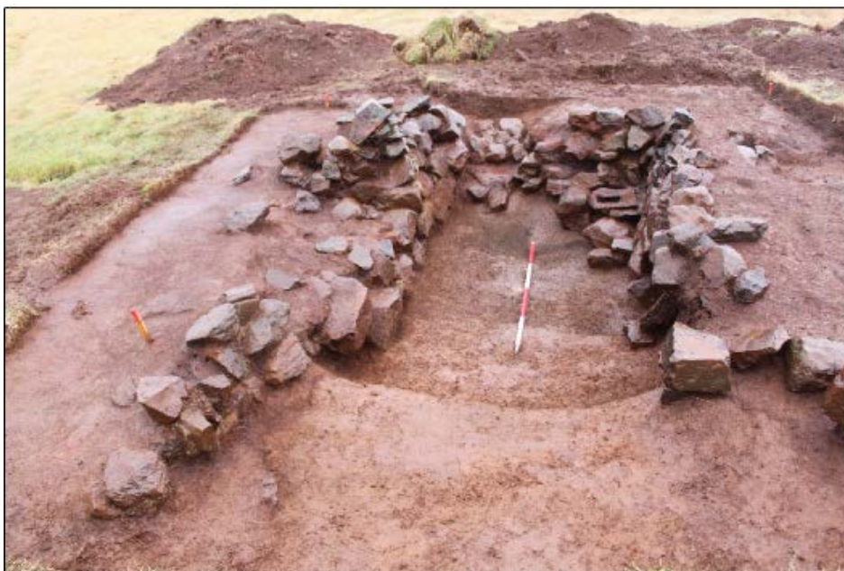
Mynd 4. Uppgröftur á tóft BO-013:003 haustið 2014.

Samkvæmt túnakorti frá 1920 var útihús ( BO-013:006 ) um 150 m norðan við bæ, um 40 m austur af útihúsi 003, og um 20 m suðvestur af vélageymslu sem er norðan Katanessbæjar. Við fornleifaskráningu 2003 sáust óglöggar leifar húsa í túninu, sem sléttað hefur verið yfir. Gerð var minniháttar forkönnun með uppgrefti á tóftinni 2014. Grafinn var aflangur skurður og í ljós kom gjóskulag frá Kötlu um 1500. Engar mannvistarleifar fundust undir því lagi. Í yngri lögum komu í ljós mannvirkjaleifar úr torfi. Ummerki á yfirborði eru villandi varðandi lögum og stærð. Mannvirkið var um 10 m (ekki 15m) á annan veginn en óvíst hve stórt það var að öðru leyti. Engir gripir eða kol eða aska fundust og má vera að hér hafi ekki staðið hús heldur e.k. gerði.