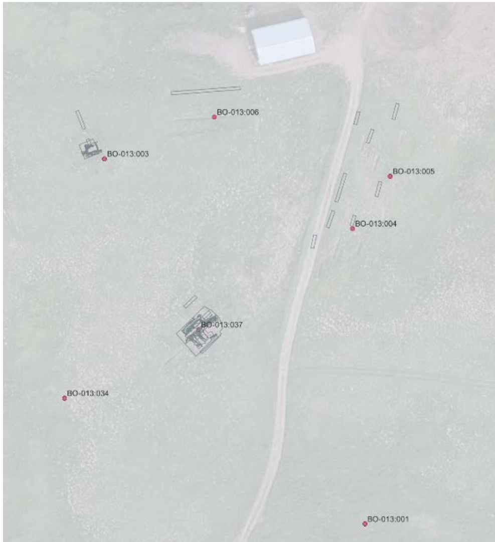
Mynd 2. Umfang rannsókna með uppgrefti. Neðst (001) er bæjarstæði Kataness. Efst er vélageymsla norðan túns. (Mæligögn FSÍ 2014; Kortagrunnur:Loftmyndir ehf 2021 ©).

Aðferðir við skráningu og forkönnun vegna fornleifa sem og löggjöfin hafa breyst talsvert s.l. aldarfjórðung. Áður lögðu stjórnvöld m.a. áherslu á að skrá ætti minjar sem sæjust á yfirborði, en ekki staði sem heimildir væru til um, en væru horfnir og jafnvel eyðilagðir. Síðustu árin hafa þessi viðmið breyst og eru nú skráðar allar þekktar minjar, enda hefur sú skráningaraðferð þann kost að safnað er upplýsingum um minjastaði sem kunna að hafa horfið sjónum, en enn gætu verið varðveittar leifar af undir sverði. Að auki hefur verið lögð aukin áhersla á að draga úr óvissu með nánari athugunum, s.s. könnunarskurðum, á framkvæmdareitum. Er það í betra samræmi við tilgang laga um fornleifavernd að halda slíkum upplýsingum til haga, en jafnframt kostur fyrir framkvæmda að lenda síður í töfum vegna óvæntra fornleifafunda við upphaf framkvæmda. Við endurskoðun og skráningu minja haustið 2023 var tekið mið af þessum nýju forsendum minjavörslu og framkvæmda.