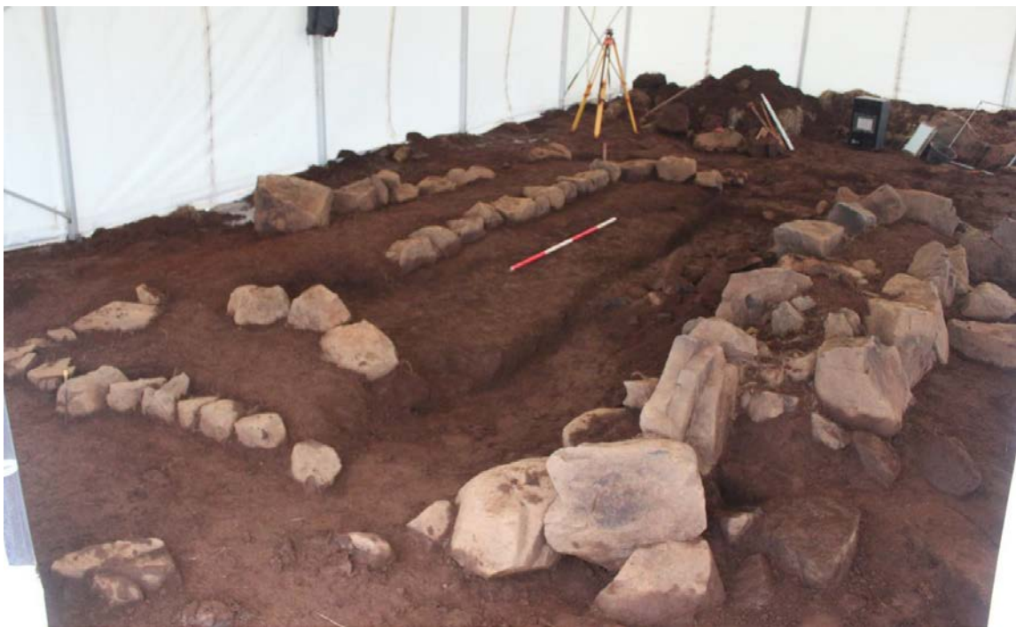
Mynd 5. Frá uppgrefti á mannvirki BO-013:037 haustið 2014.

Við vettvangsathugun 2014 fundust áður óþekktar mannvirkjaleifar ( BO-013:37 ) í túninu um 100 m NNA við Katanesbæ. Á yfirborði voru þær sem óljóstar þústir en þegar grafinn var könnunarskurður sem tók af allan vafa um að þar leyndust umtalsverðar mannvistarleifar. Var því gerð fullnaðarrannsókn 2015, sem leiddi í ljós mannvirki úr torfi og grjóti, með steinlagða stétt utan við. Hlutverk þess er óþekkt, en gripir sem fundust gefa einungis grófa vísbendingu um aldur, eða frá 16. til 19. aldar.