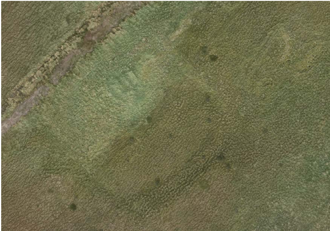
Mynd 6. Tóftir og garðlag á Stekkjarhól (020:01, 02 og 03). Mynd og uppmæling með flygildi og Lidar 9. september 2023 (FSÍ).

samkvæmt örnefnalýsingu. Við nánari athugun haustið 2023 hefur komið í ljós að líklega standa þessar tóftir á eldri mannvirkjum, þ.e. tóft eða þúst austan megin ( BO-013:020:02 ) og garðlagi eða gerði sunnan og vestan við hólinn ( BO-013:020:03 ). Rask vegna framræslu og ræktunar kann að hafa eytt hluta af þessum minjum.